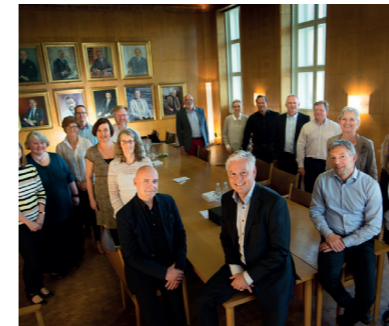
DiaLabs bestyrelse og udvalg

Udvalgene består af DiaLabs medlemmer og mødes mellem to og otte gange om året.