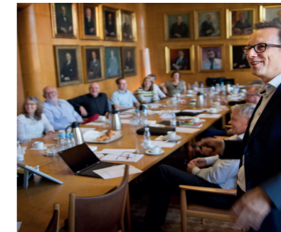
Udvalgsarbejde i DiaLab